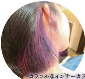
カラフルなインナーカラー！ 1色ではなく、2~3色を いれるのがオススメ♪