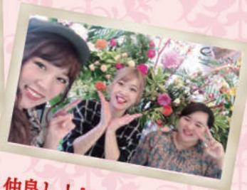
チルアウトは 『とにかく仲良し!』