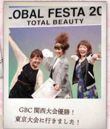
GBC 関西大会優勝! 東京大会に行きました!