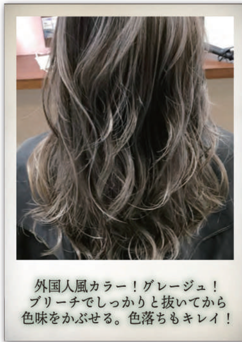
外国人風カラー！グレイージュ！ ブリーチでしっかりと抜いてから 色味をかぶせる。色落ちもキレイ！