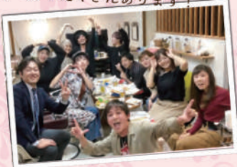
イベントたくさんあります!