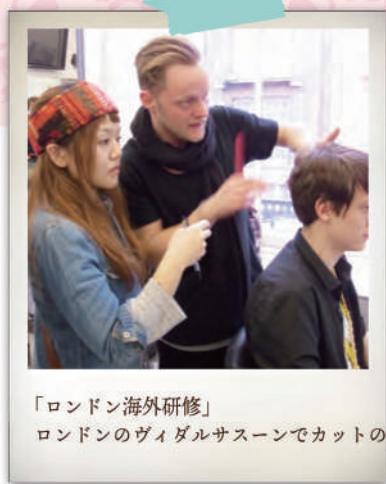
「ロンドン海外研修」 ロンドンのヴィダルサスーンでカットの勉強。