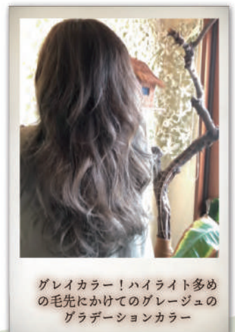
グレイカラー！ハイライト多め の毛先にかけてのグレイージュの グラデーションカラー