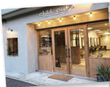
chill out 本店