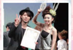
サロンワークだけではなく、 いろいろな経験が出来ます!