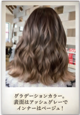
グラデーションカラー。 表面はアッシュグレーで インナーはベージュ！

chill outのデザインカラーはナチュラルなスタイルから個性的なスタイルまで、幅広く対応しています！ 特に「ナチュラルハイライト」をされるお客様が多くいます！