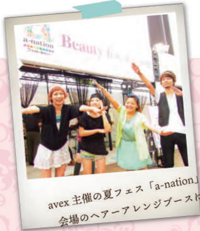
avex 主催の夏フェス「a-nation」 会場のヘアアレンジブースに参加!