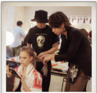
東京コレクションバックステージ ヘアメイクのアシスタントで参加!