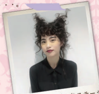
神戸コレクションのバックステージ にも何度も参加!