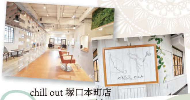
chill out 塚口本町店